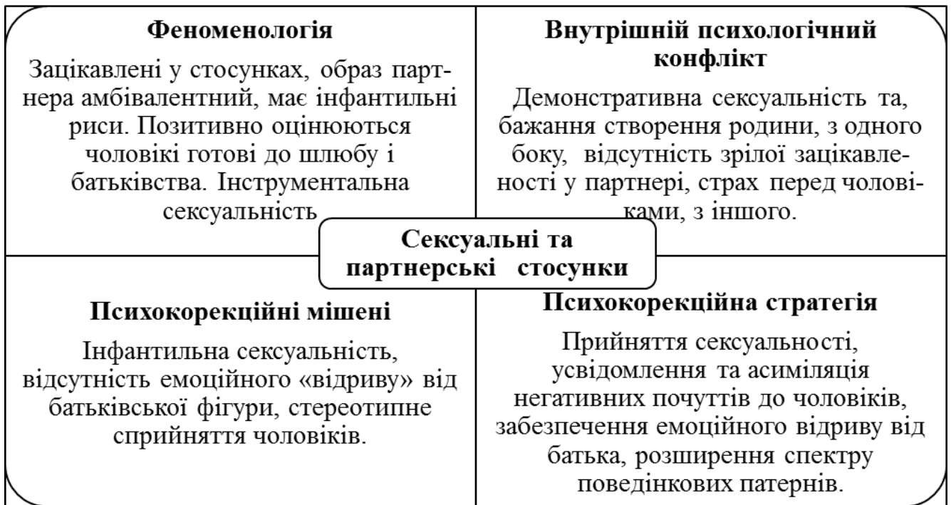
Рис. 3. Інтегративна модель психодіагностики та психокорекції континуально-альтернативної структури особистості у жінок (сексуальні і партнерських стосунки)

Інтегративна діагностично-психокорекційна модель, яка базується на отриманих емпіричних даних може бути рекомендована для використання у практичній психологічній діяльності.